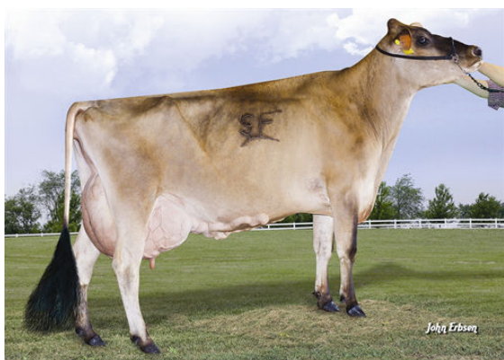
JX FARIA BROTHERS ACTION DEAN SMITH {1} GRANDDAM